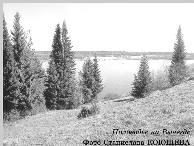
Половодье на Вычегде