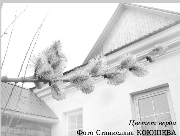
Цветет верба