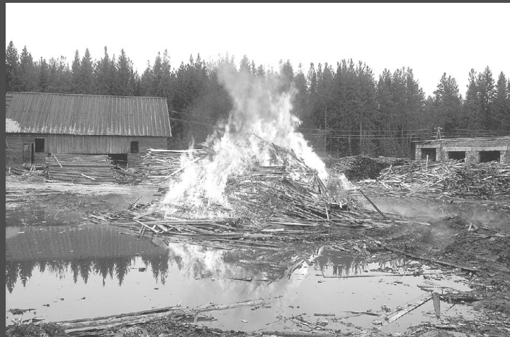
На территории бывшей базы райсельхозхимии в райцентре сжигают отходы производства.