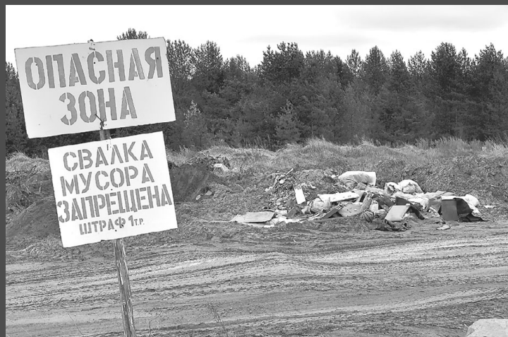
Гора мусора возле старого карьера в местечке Аэропорт с. Корткерос.