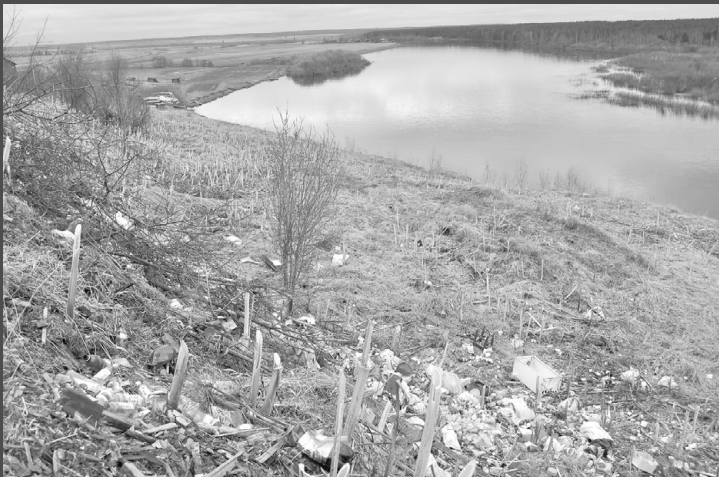
В д. Сюзяб такие несанкционированные свалки навалены вдоль всего берега р. Вишера. Некоторый мусор (стекла, банки, пластик) уже спустился до воды.