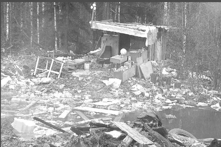
Придорожная полоса свалки ООО Корткеросская управляющая компания.