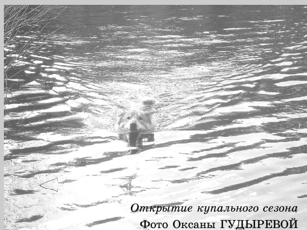
Открытие купального сезона